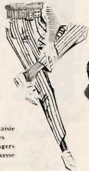
Pantalon Ceinturon Très grand choix