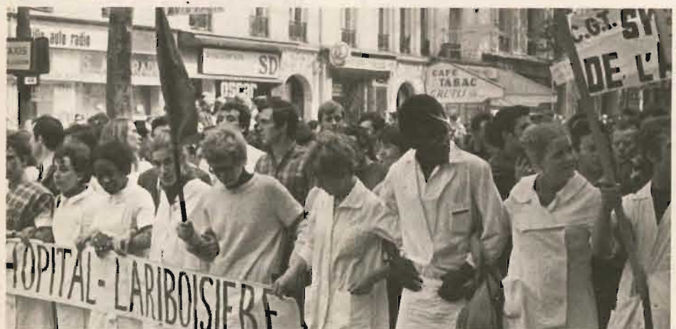
Aux piquets de grève, aux manifestations syndicales, se joignent nombre de ces travailleurs surexploités que sont les immigrés et les Antillais