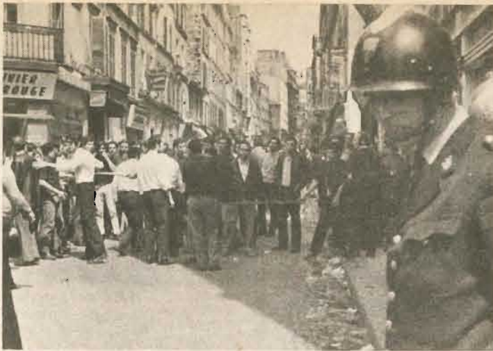
Ce jour-là, la police était étrangement indifférente...