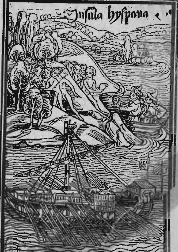
Un « instantant », de débarquement de Colomb à Haîti (Gravus sur bois de 1494)