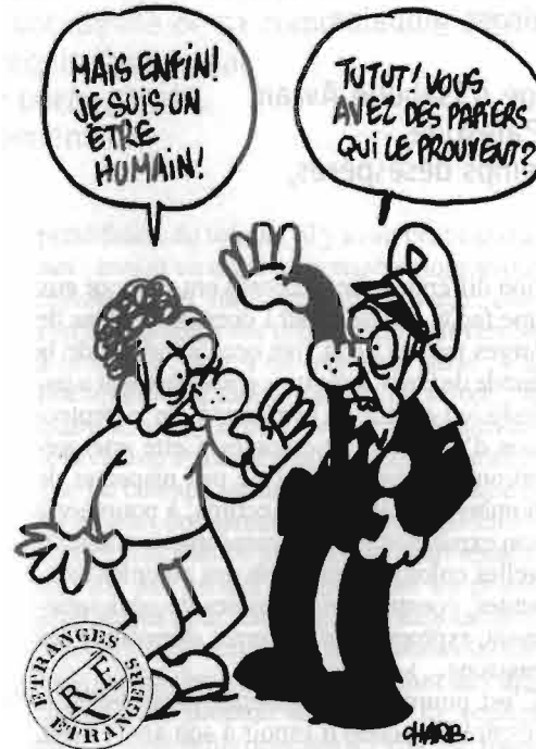
Reproduction de l'une des trois cartes postales en vente au siège du Mrap au prix de 5 F l'unité