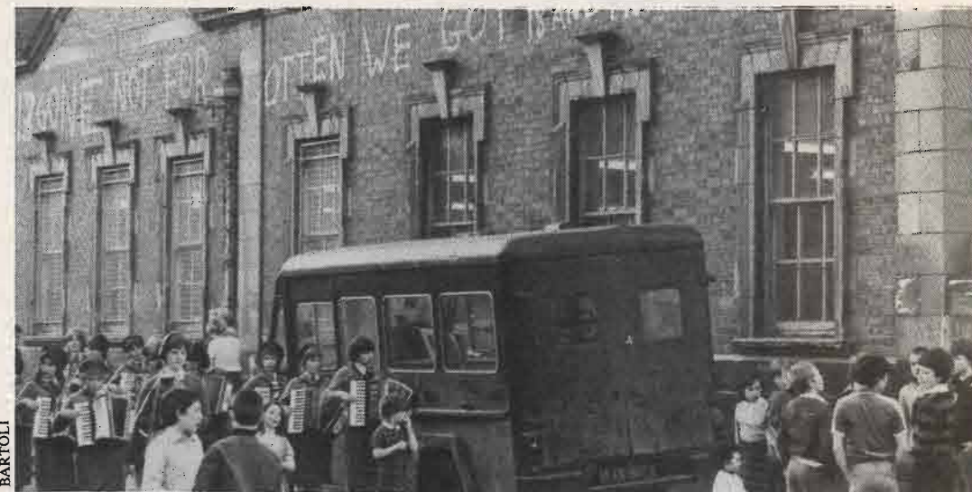
Devant le local du Sinn Féin, à Falls (West Belfast), sur le mur : « Treize sont partis et n'ont pas été oubliés. Nous en vivons eu dix-huit et Mountbatten ».