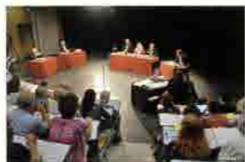
Vue du tribunal et de la salle d'audience.

L'acte d'accusation reprochait à l'Etat et aux collectivités territoriales d'avoir porté atteinte aux droits des enfants roms