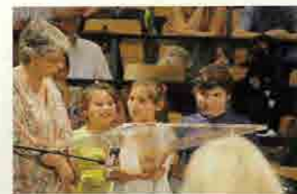
Pour une fois, c'est l'Etat qui était au banc des accusés.

Viennent à la barre témoins et experts qui évoquent la difficulté de parvenir à une scolarité stable, malgré les dispositifs qui peuvent être mis en place par l'Education nationale, du fait des expulsions répétées des lieux de vie. Les témoignages mettent en évidence les traumatismes vécus par les enfants. « Ils sont habitués à changer, à être expulsés, ils ont peur de la police ». Accompagnés de leurs enseignants, des enfants de Bobigny racontent le trajet d'une heure chaque matin pour continuer à venir à leur école, les expulsions à répétition. Une pédiatre de Médecins