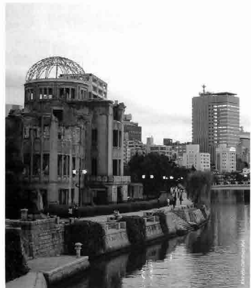
Le dôme de Genbaku (bombe atomique) à Hiroshima est devenu un monument universel pour l'humanité entière, symbolisant l'espoir d'une paix perpétuelle et l'abolition définitive de toutes les armes nucléaires sur la Terre.

C'est la raison pour laquelle la campagne internationale pour le désarmement nucléaire (ICAN) soutient le projet d'établir un traité d'interdiction des armes nucléaires contraignant, tels que l'on été les autres traités interdisant les armes chimiques ou biologiques. Ce traité d'interdiction est facile à construire. L'utilisation de matériel nucléaire est bien plus facile à contrôler que le matériel chimique et biologique, et nous disposons avec