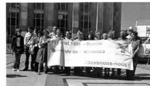
Fin du rassemblement en souvenir des 20 ans du génocide de Srebrenica. Paris des Droits de l'Homme le 11 juillet 2015. Le MRAP était présent.