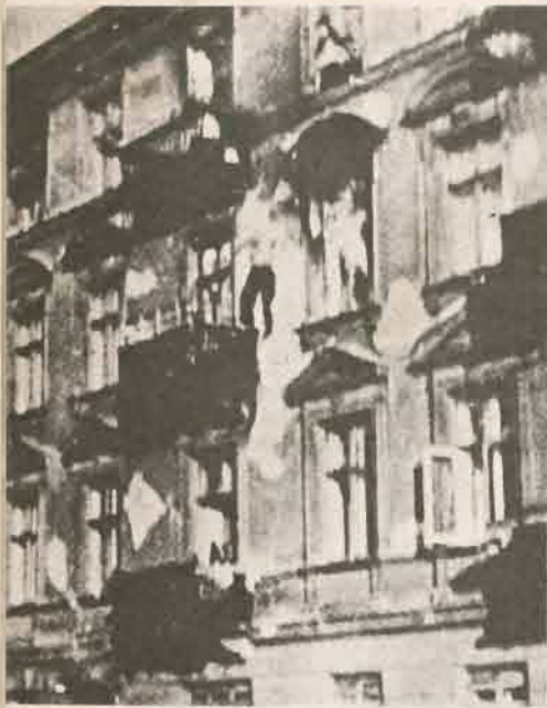
Pendant l'insurrection, un combattant se jette d'un immeuble en flammes