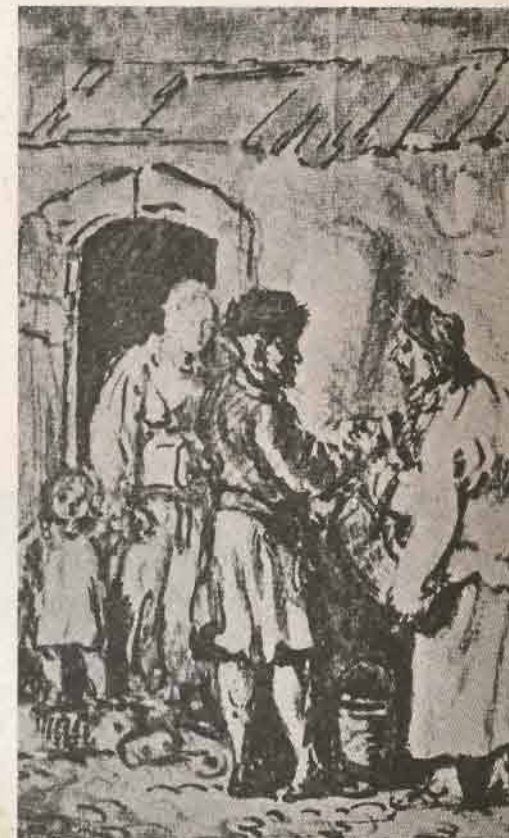
Commerçants juifs à Varsovie en 1783.

Le journal « Gazeta Rzeczpospolita » (17-18 avril 1794), écrit : « Alors que Varsovie menait une lutte sanglante contre l'ennemi, les juifs habitant la capitale ont combattu héroïquement, les armes à la main, montrant au monde que, là où l'humanité peut gagner, ils risquent leur vie. » Un témoin de la ba-