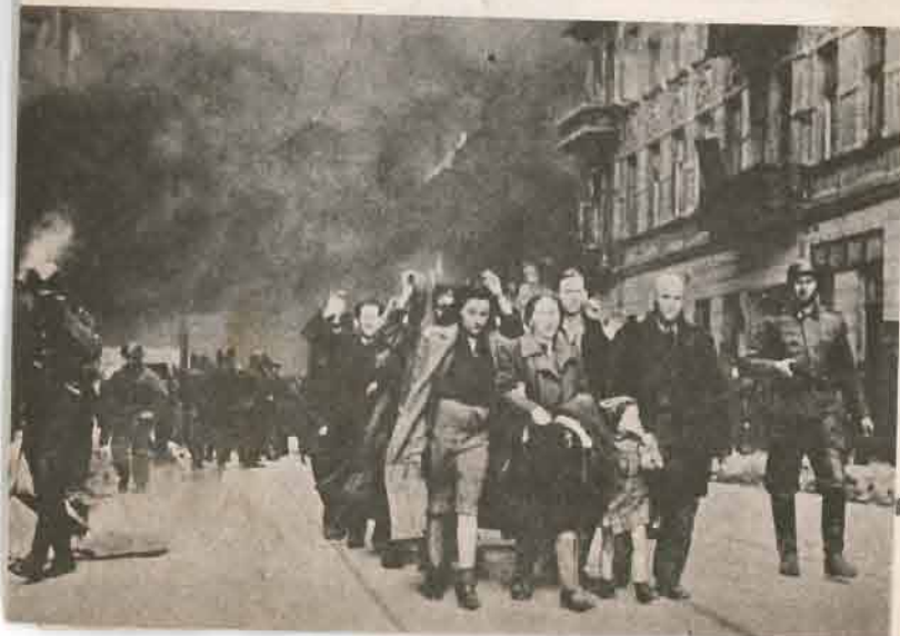
Une rafle dans le ghetto.

Pour mener à bien leur entreprise d'extermination, les nazis avaient créé un corps de 2 000 policiers juifs, qui leur fournissaient une aide précieuse ;