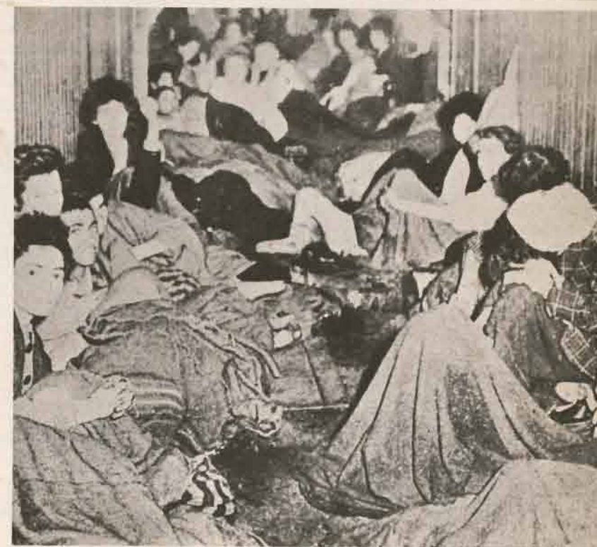
La population cherche abri dans les casemates aménagées par les résistants. Très peu en sortiront vivants...

Aujourd'hui à 20 h 16, s'est terminée la grande opération ». Pour marquer l'évènement, il donna l'ordre, à la demande d'Himmler, de faire sauter la grande synagogue, rue Tlomacki.