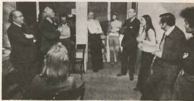
Le président du M.R.A.P. félicite les lauréats des J.I.F.A.

tion, le champ demeure libre pour la mise en évidence des problèmes sociaux, politiques, économiques que le racisme « masquait », que la situation nouvelle fait lever.