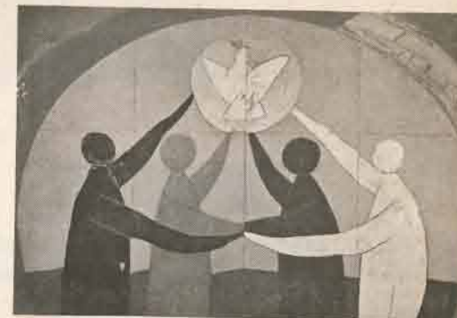
« Les quatre parties du monde » qui se trouve à Vallauris, illustre la couverture du numéro spécial de « Droit & Liberté » consacré à l'Année internationale de lutte contre le racisme et la discrimination raciale.