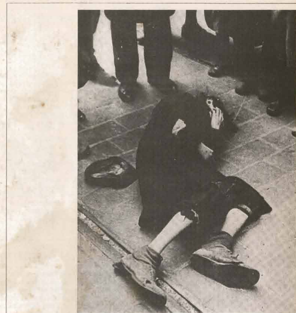
Celui-ci, comme des centaines chaque jour, est mort de faim sur le trottoir. Il ira rejoindre d'autres victimes dans d'anonymes fosses communes creusées à la hâte.