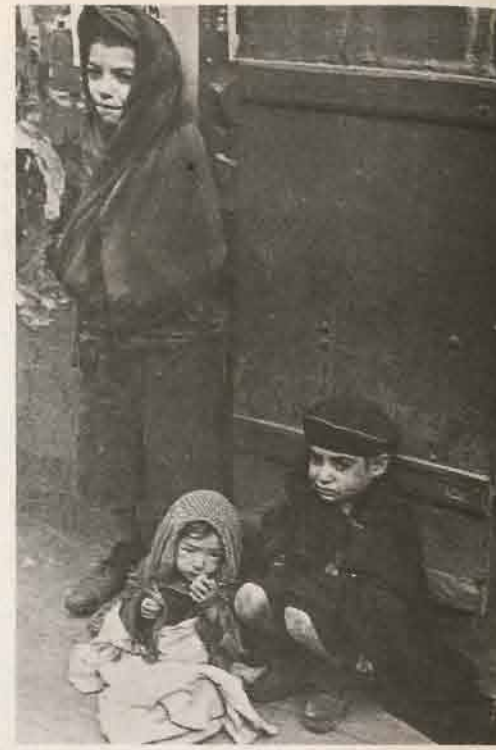
Des enfants que la misère condamne sans appel...

Qu'elle incite dans les siècles leurs descendants à garder l'espérance comme ce poète d'une autre insurrection juive qui jetait son cri aux hommes de l'avenir : « Ne dis jamais : ce pas sera mon dernier pas ! »