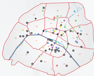
□ Rue Louis Delgrès - 75020 Paris