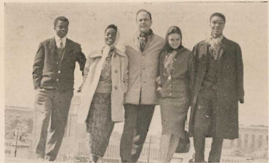
Jean Rouch — que l'on voit ici avec plusieurs interprètes de son film « La Pyramide Humaine » — apporta à l'émission un concours unanimement apprécié.

Or si nous sommes tous racistes, et spontanément, comme « naturellement », les bonnes âmes concluront au seul remède de la réforme des esprits par de bonnes paroles. On piétinera dans la confusion. Et les racistes et leurs alliés actifs, plus ou moins dissimulés — les ex-colaborateurs de l'occupant, par exemple, les feuilles ultra-colonialistes, les militaristes allemands d'aujourd'hui, etc. — auront le champ libre et poursuivront leur besogne infernale d'incessante et résiduelle préparation d'artillerie — psychologique — au recommencement des