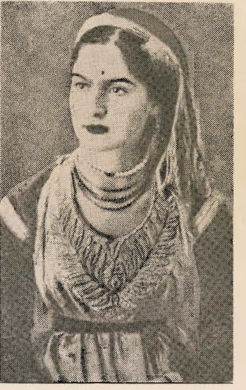
Une musulmane, à Alger. Une juive algérienne vêtue du costume traditionnel.

chrétiens : rien qui ressemble aux persécutions de Justinien, des Wisigoths d'Espagne, ni aux massacres du XI e siècle en France et en Allemagne.